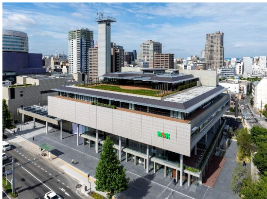
RSKイノベティブ・メディアセンター

グランドオープン後、倉敷ライオンズクラブのメンバーの皆様方で岡山市内にお出掛けの際には是非、お立ち寄り頂ければ有難いです。5階社員食堂からの借景は紹介ビデオ以上に素晴らしい景色です。お待ちしております。