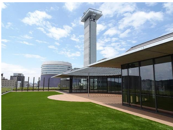
食堂前 絶景の広場