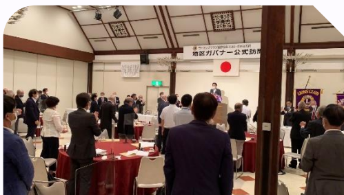
今年は輪にならず、L小田の閉会挨拶とその場でライオンズ・ローア