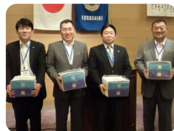
5月 誕生祝の皆さん

先日 G7 教育相会合、無事終了しました。大原美術館は公式晩餐会の会場となり、物々しい雰囲気でした。倉敷国際ホテルの皆様はじめ関係の方々、お疲れ様でした。 50 枚