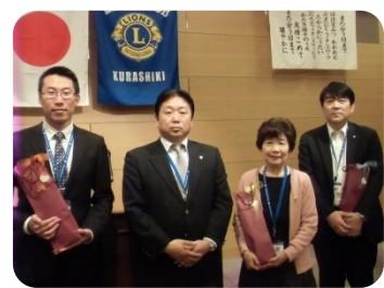
5月 結婚祝の皆さん